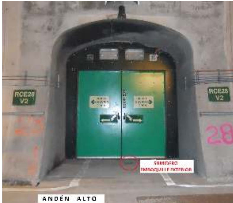
Ilustración 4 - Elementos de emboquille exterior