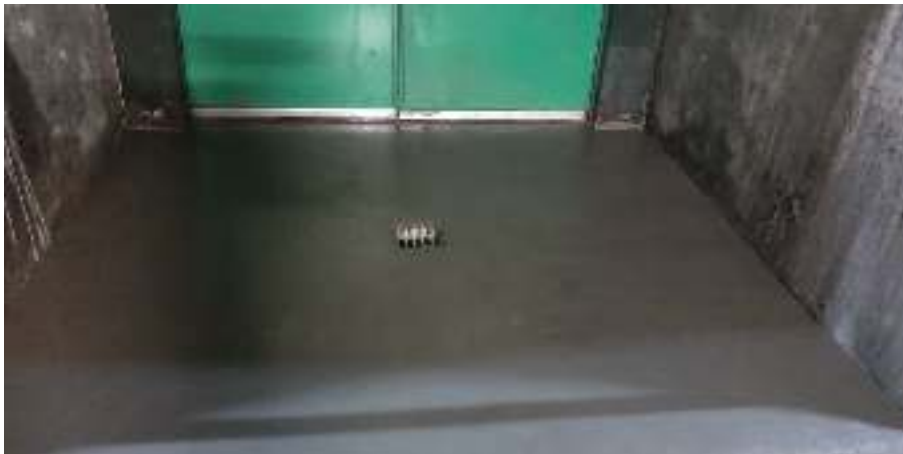
Ilustración 8 – Ejemplo de acabado de solera de emboquille exterior.