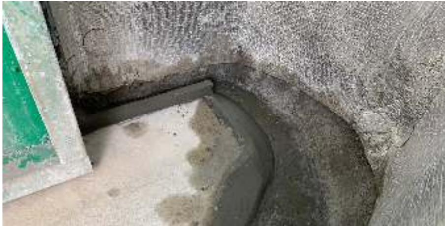
Ilustración 12 - Ejemplo murete de Lamocem junto a pletina