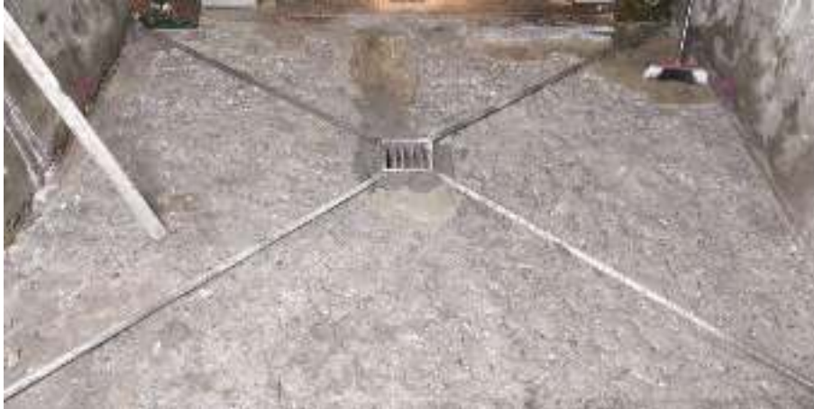
Ilustración 7 - Ejemplo de reubicación de sumidero, picado de solera y nivelación previo a hormigonado en solera exterior

A continuación, se adjuntan fotos aclaratorias de los trabajos comentados.