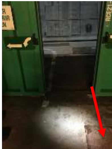
Ilustración 5 - Dirección de evacuación de las aguas del emboquille exterior del túnel.

El emboquille interior presenta dimensiones desiguales para cada ramal. A criterio de LFP, se ha estimado que el emboquille interior comprende aproximadamente desde la puerta hasta 3ml hacia el interior del ramal., siendo ésta la zona sobre la que se tendrán que realizar los trabajos designados en el apartado 5 del presente pliego. Dicha superficie ronda aproximadamente los 11m 2 .