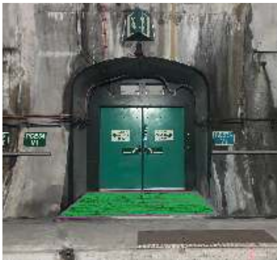
Ilustración 2 - Delimitación emboquille exterior de un ramal