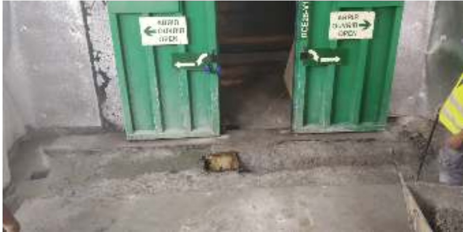
Ilustración 9 - Ejemplo demolición solera interior