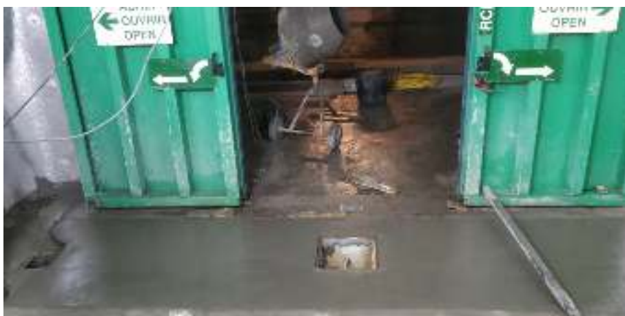
Ilustración 11 - Ejemplo solera de emboquilla interior hormigonada