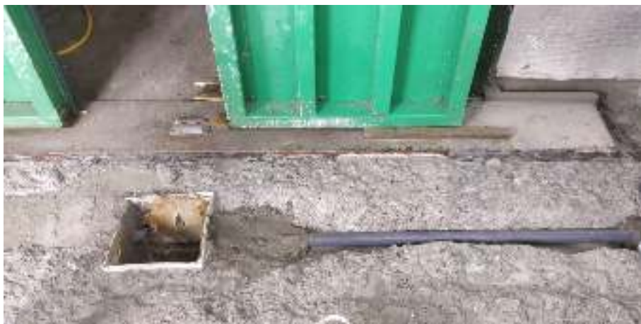
Ilustración 10 - Ejemplo instalación nuevo drenaje lateral en emboquilla interior