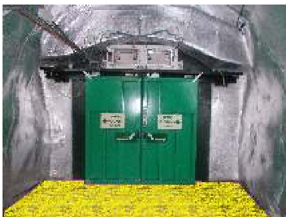
Ilustración 3 - Delimitación emboquille interior de un ramal

El emboquille exterior tiene unas dimensiones aproximadas de 9m 2 . Presenta un sumidero en la parte más cercana a la puerta, encargado de drenar toda la superficie del emboquille (ver Ilustración 4). Este drenaje transcurre bajo la puerta del ramal, y va parar a la arqueta existente junto a la puerta por el lado interior (ver Ilustración 5).